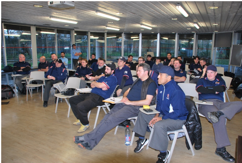
Clinic Arbitrage Baseball à l'INSEP le 16 janvier 2016

VAUREAL : manque les engagements des arbitres (vu avec le club = en cours)