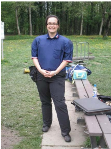
Avec plastron souple