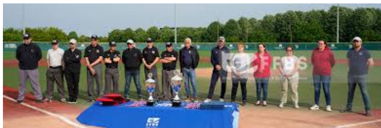
Challenge de France 2023