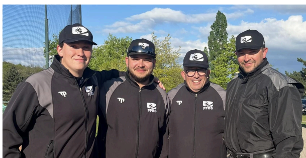
Les 4 arbitres français assignés lors de cette compétition

Les échanges avec les UIC (Umpire in Chief) ont permis de pérenniser la présence sur les années à venir sur cette compétition. Cette démarche permettra de pouvoir tester à l'international les nouveaux prospects de l'arbitrage de nos disciplines.