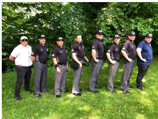
Équipe arbitrale du Challenge de France Baseball