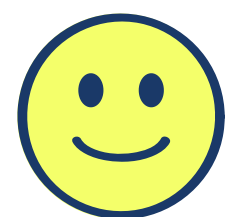
IMAGE D'ENGAGEMENT CITOYEN

Véritables ambassadeurs de l'esprit sportif , ces pratiquants valorisent l'image du club et montrent que le Softball est une école de vie , renforçant la fierté d'appartenance de tous les membres.